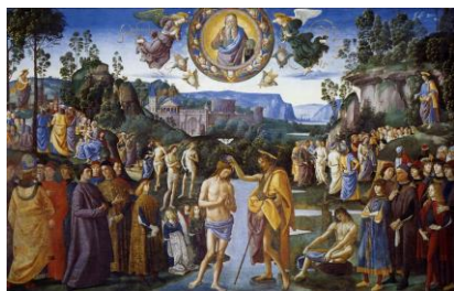
Perugino – Batismo de Jesus (1481-1483)